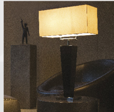
Viva Slim Duo M Oberfläche Lack schwarz glänzend Schirm Contessa 374 rechteckig