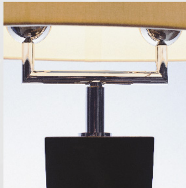
Leuchtenarm mit 2 Fassungen Leuchtmittel E 14 Abstand 15 cm