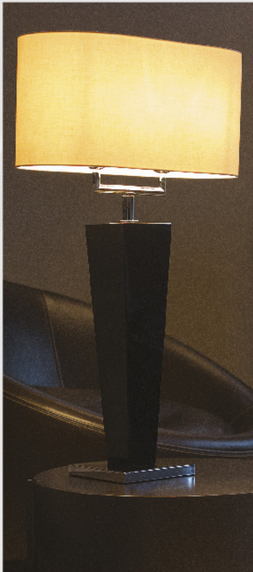
Viva Slim Duo M Oberfläche Lack schwarz glänzend Schirm Contessa 374 stadionform Sockel Chrom