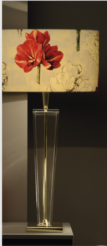
Viva Slim Acryl L Oberfläche Acryl klar Schirm Pierre Frey Sockel Messing poliert