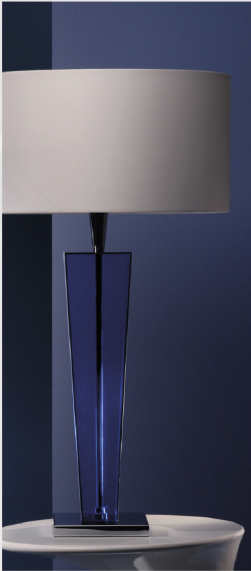
Viva Slim Acryl L Oberfläche Acryl dunkelblau Schirm Contessa weiß 192 Sockel Chrom